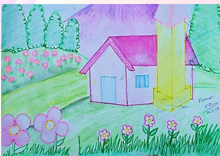
ELINA BORO CLASS III