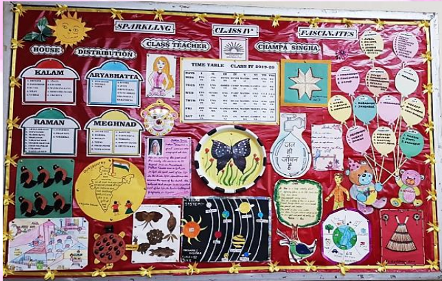
DISPLAY BOARD COMPETITION