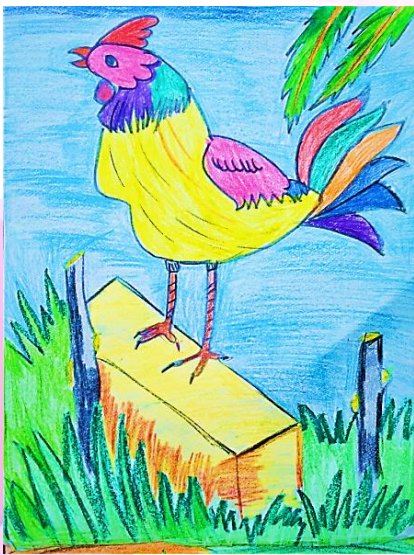
AYUSHI MILI CLASS IV