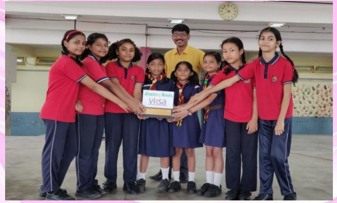
ROUTES TO ROOTS 2 ND PRIZE