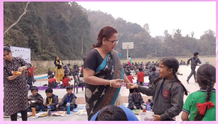
COMMUNITY LUNCH- a step towards cultural integration