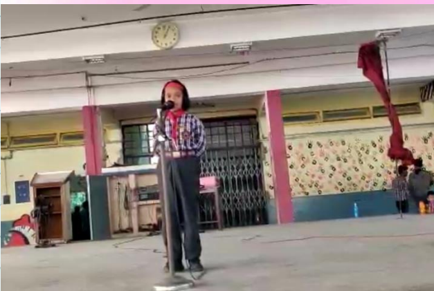
SOLO SONG COMPETITION