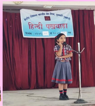
STORY TELLING COMPETITION